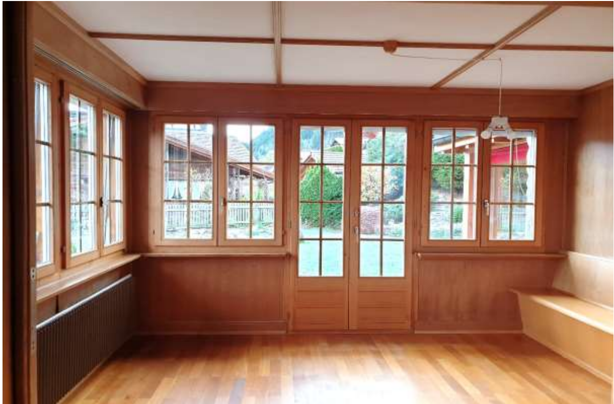
Das Esszimmer mit anschliessender separater Küche