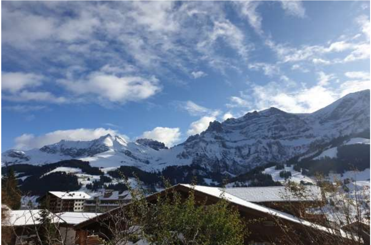
Der Garten mit Sitzplatz mit Aussicht vom Elsiehorn bis zum Wildstrubel