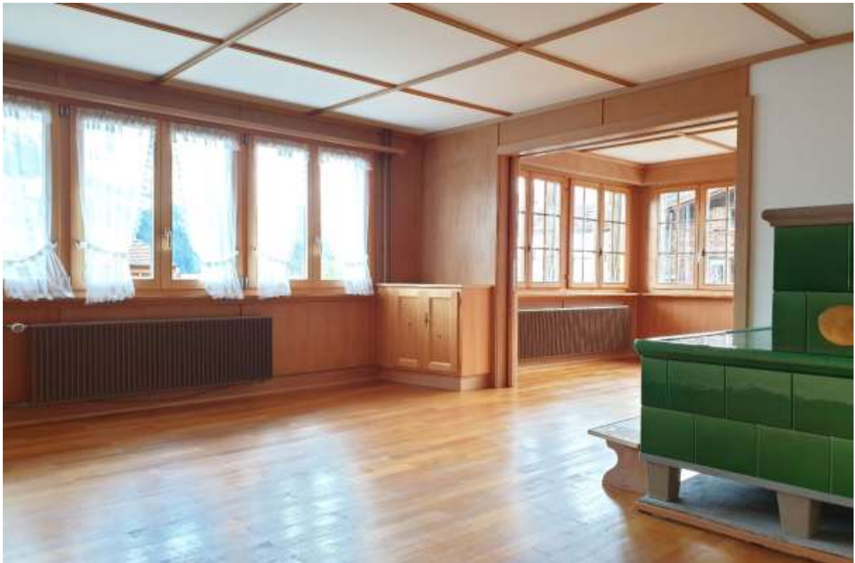
Offenes Wohn- und Esszimmer mit gemütlichen Sitzsofen