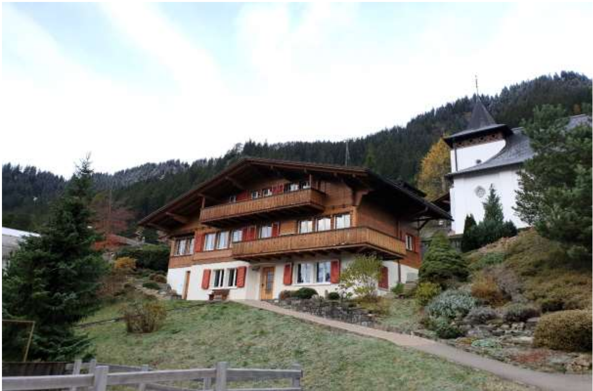
Der Zugang zum Wohnhaus