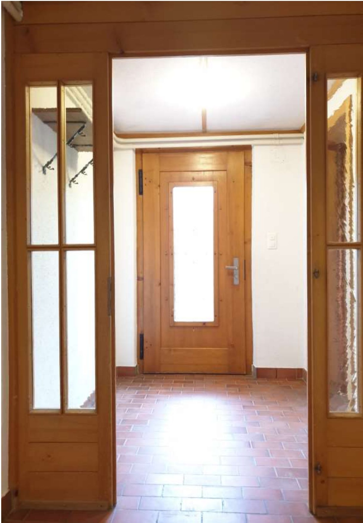
Der grosszügiger Eingangsbereich mit Garderobe im EG