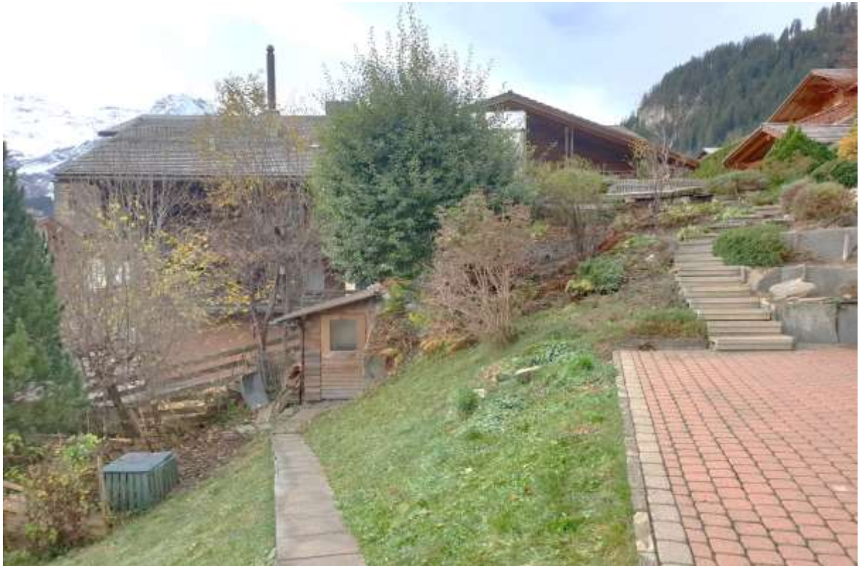
Der Vorplatz und Zugang zum Holzschopf und in den Garten