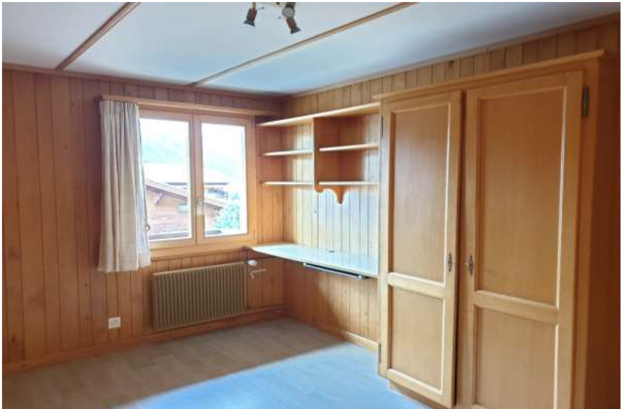
Zimmer Nr.4 mit Einbauschränk und Regal