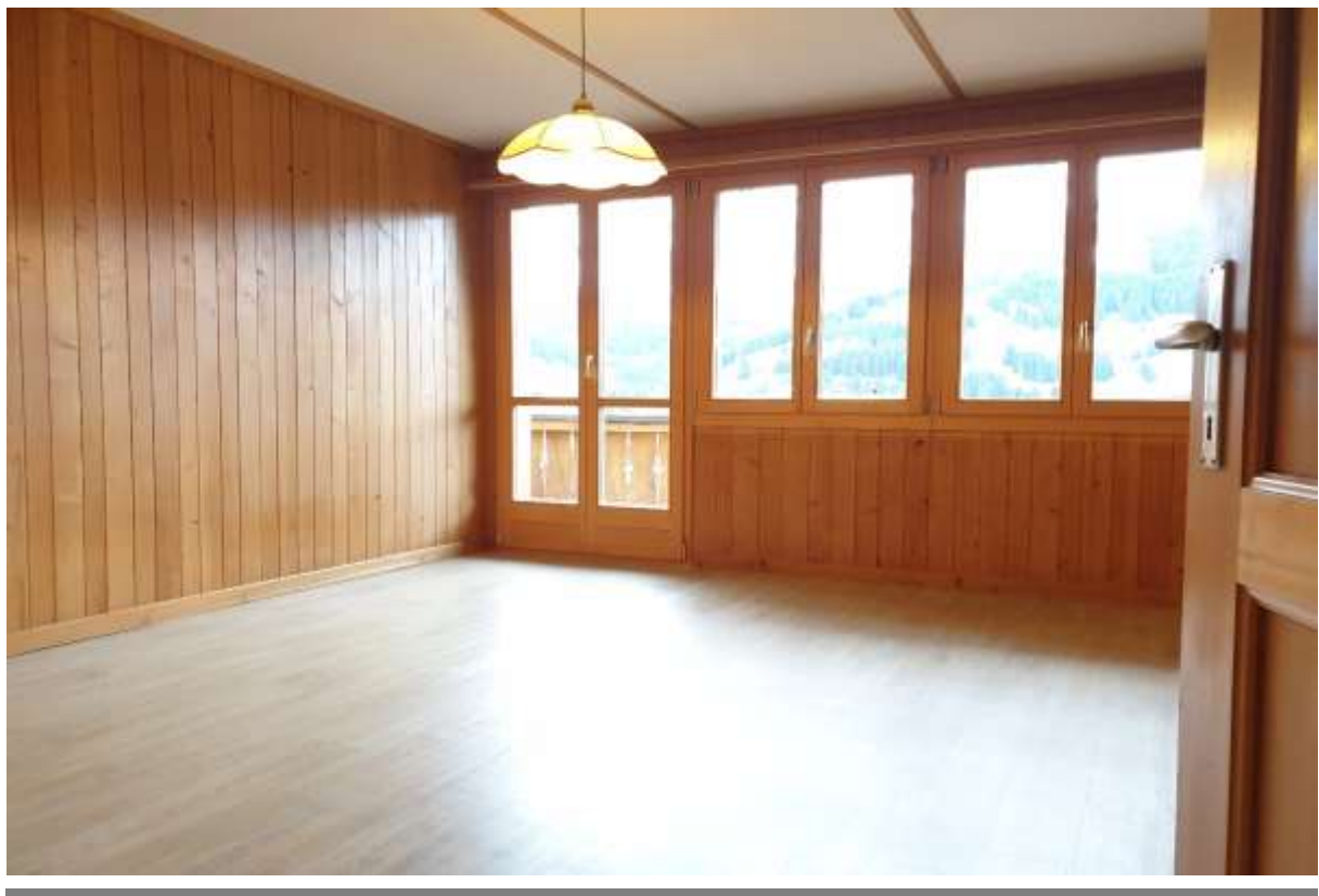
Zimmer Nr.3 mit Ausgang auf den Balkon