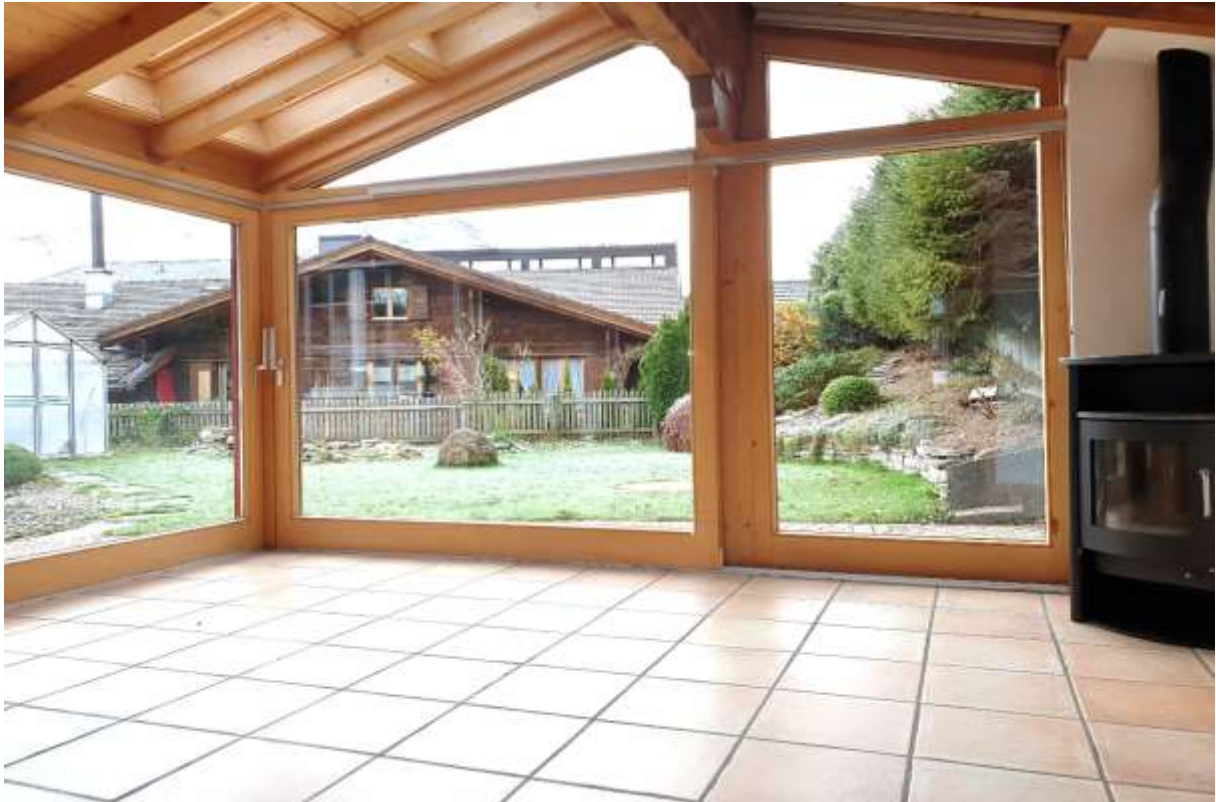
Der Wintergarten mit Schwedenofen – Ausgang in den Garten