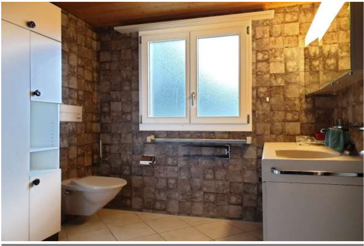
Das Badezimmer mit Dusche, Toilette und Handwaschbecken