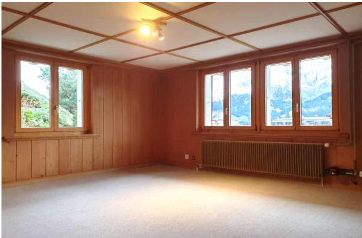
Zimmer Nr. 2 im EG