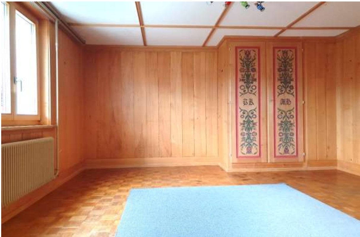
Zimmer Nr. 1 mit Einbauschränk und Handwaschbecken im EG