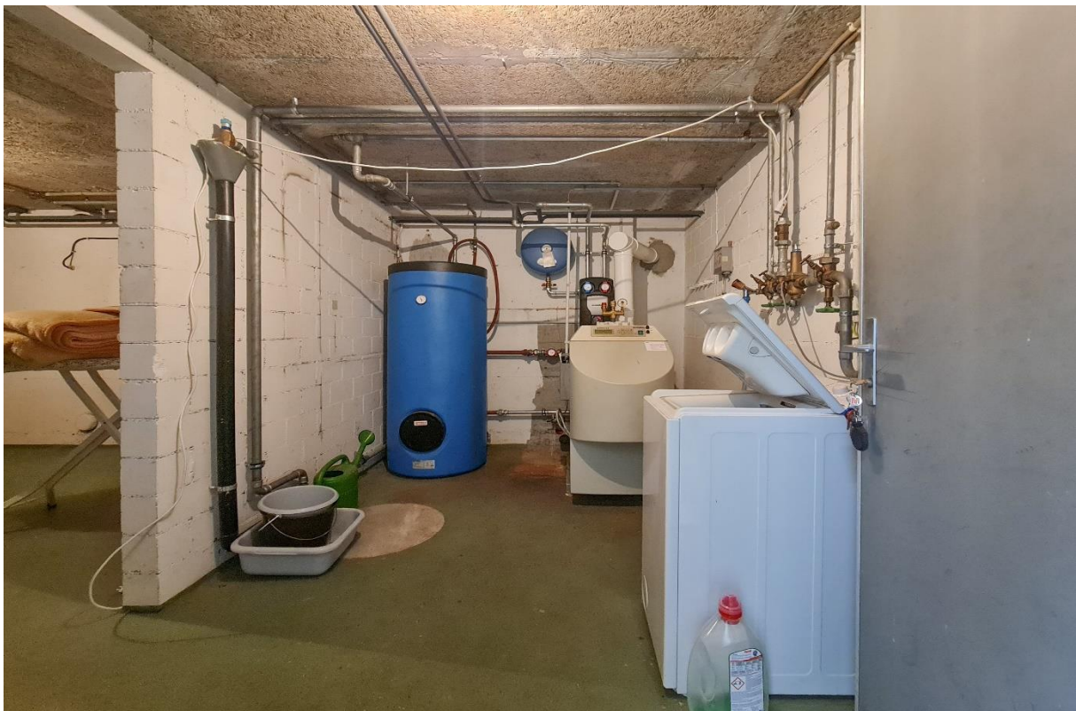
Die gemeinschaftliche Waschküche mit Trockenraum nebenan