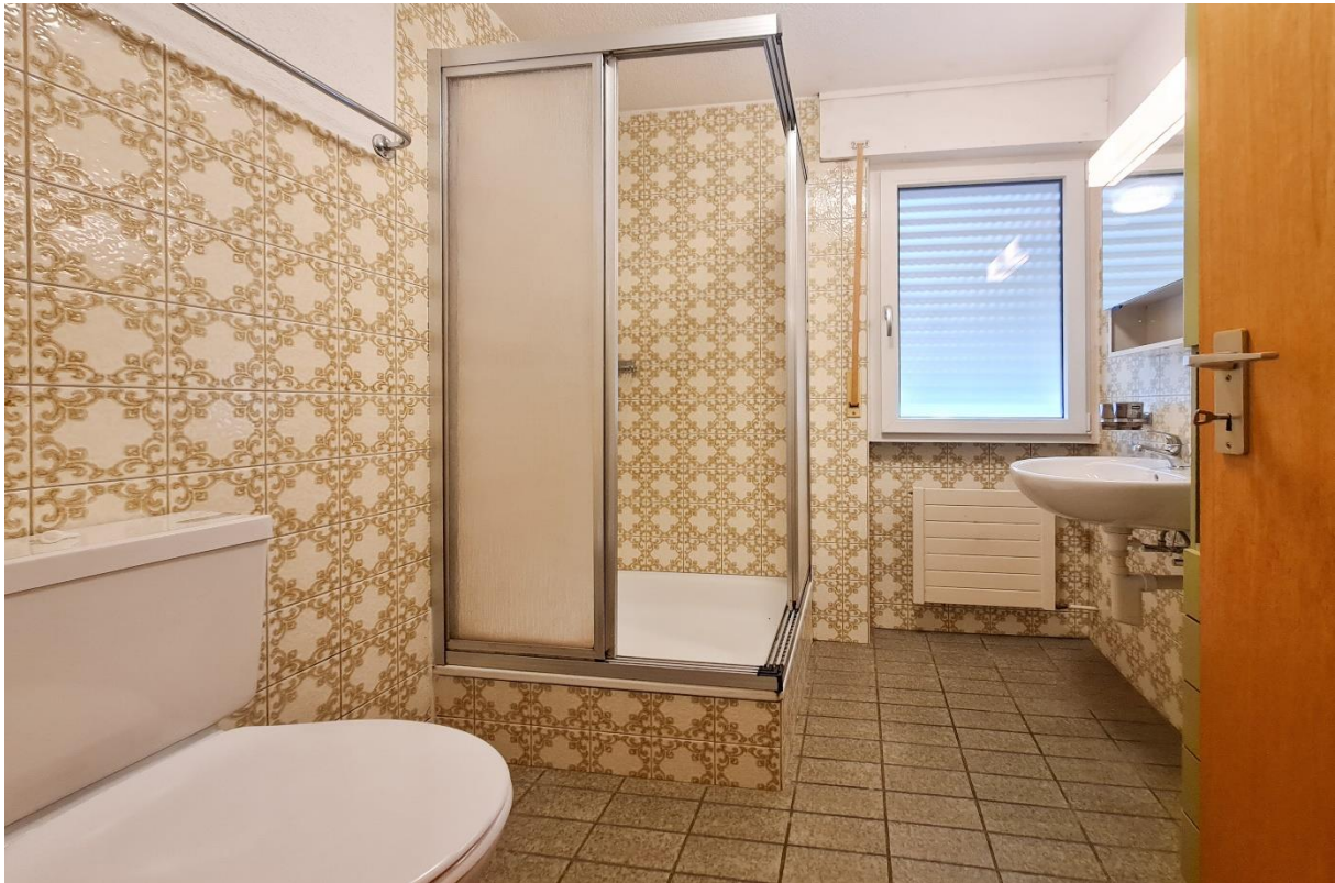
Das Badezimmer mit Dusche, Toilette, Handwaschbecken und Fenster