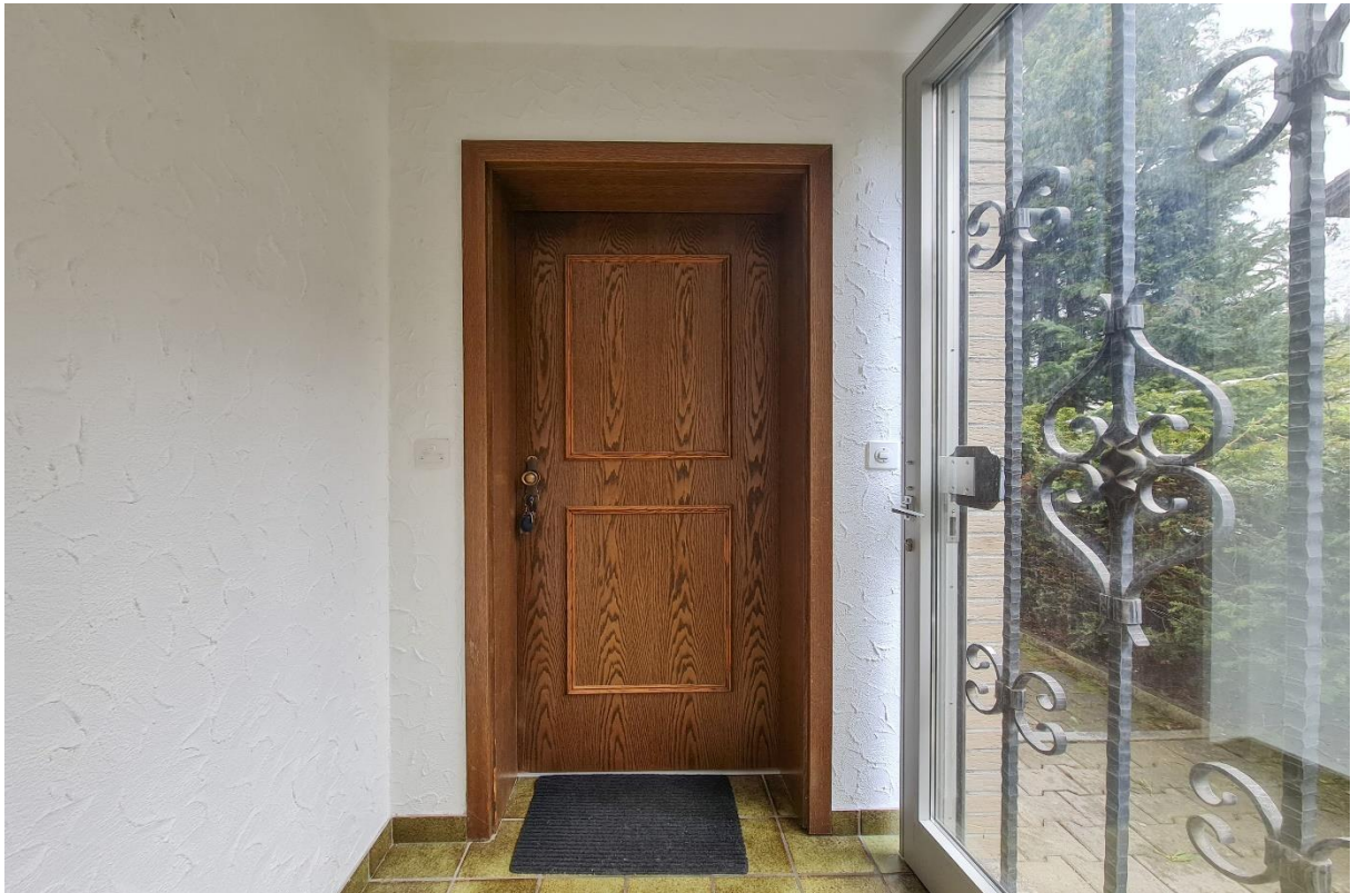
Der geschlossene Eingangsbereich mit dem Zugang in die 1.5 Zimmer Wohnung