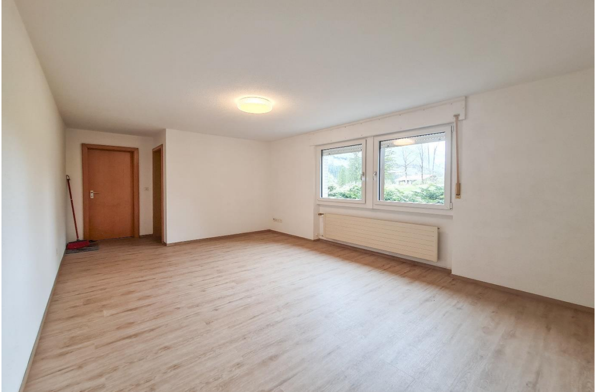
Der Blick von der Eingangstüre durch den Wohn-Schlafbereich zum Bad und Küche