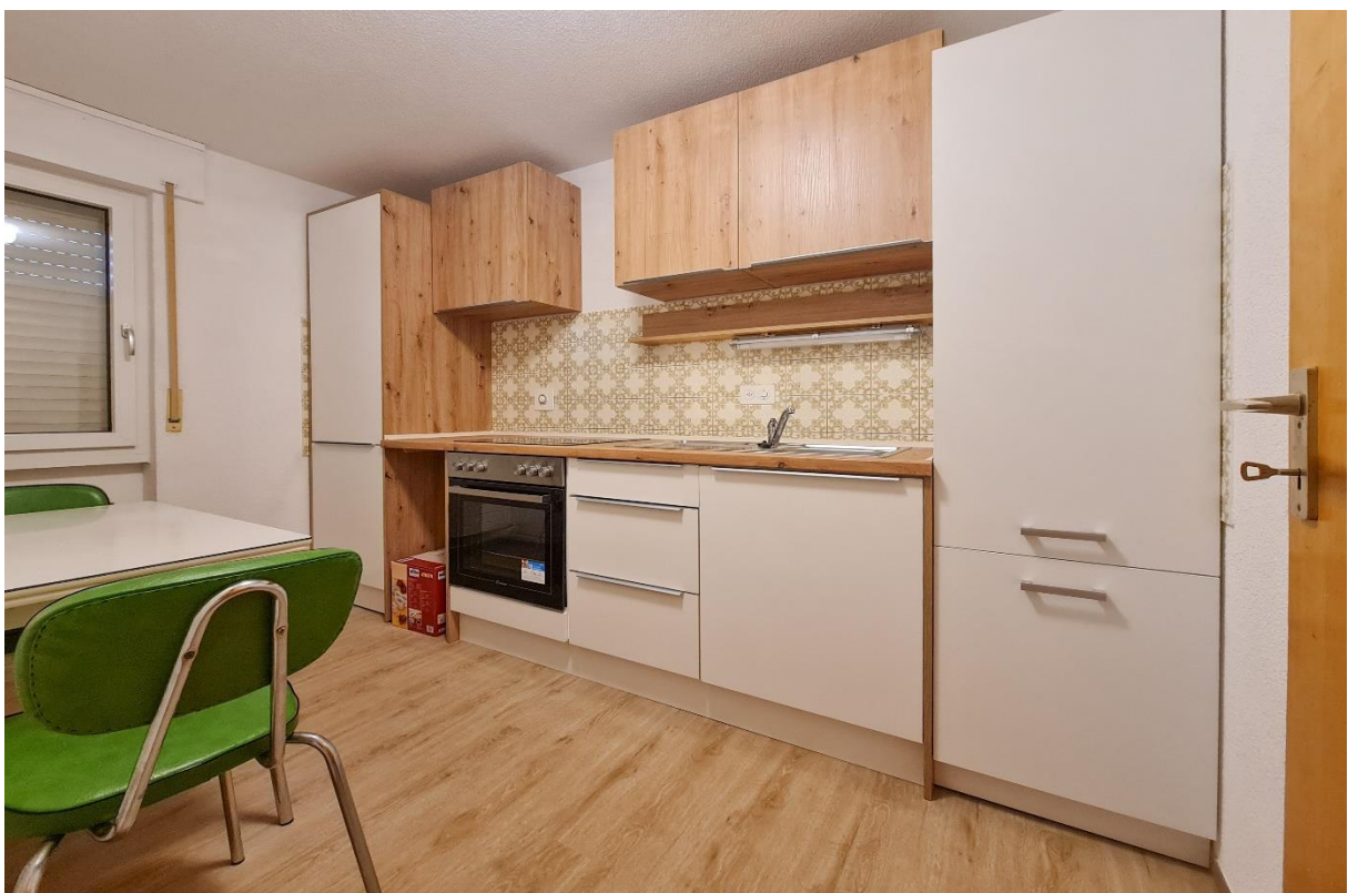
Die separate Küche mit Essbereich