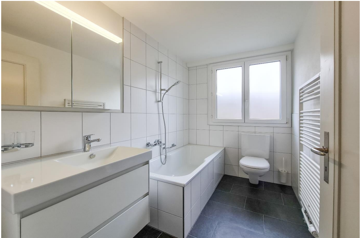
Das Badezimmer mit Handwaschbecken, Badewanne, Toilette und Handtuchradiator