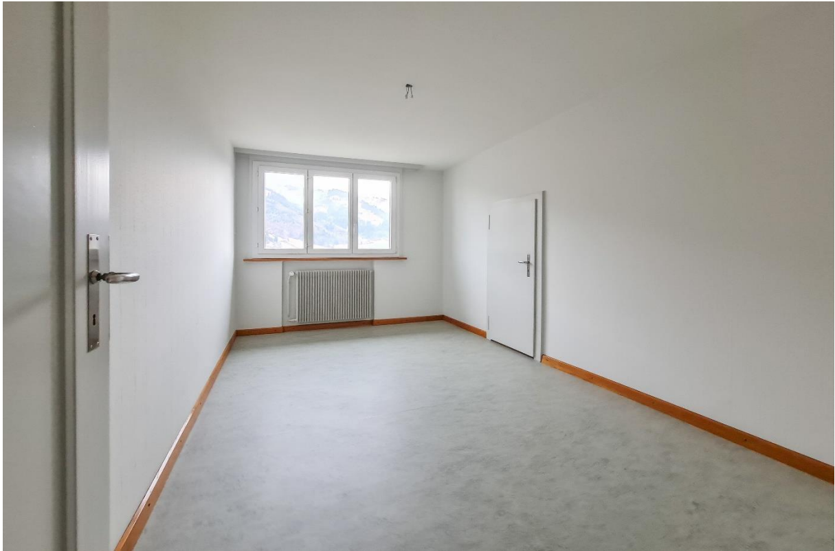
Zimmer Nr. 2 ...