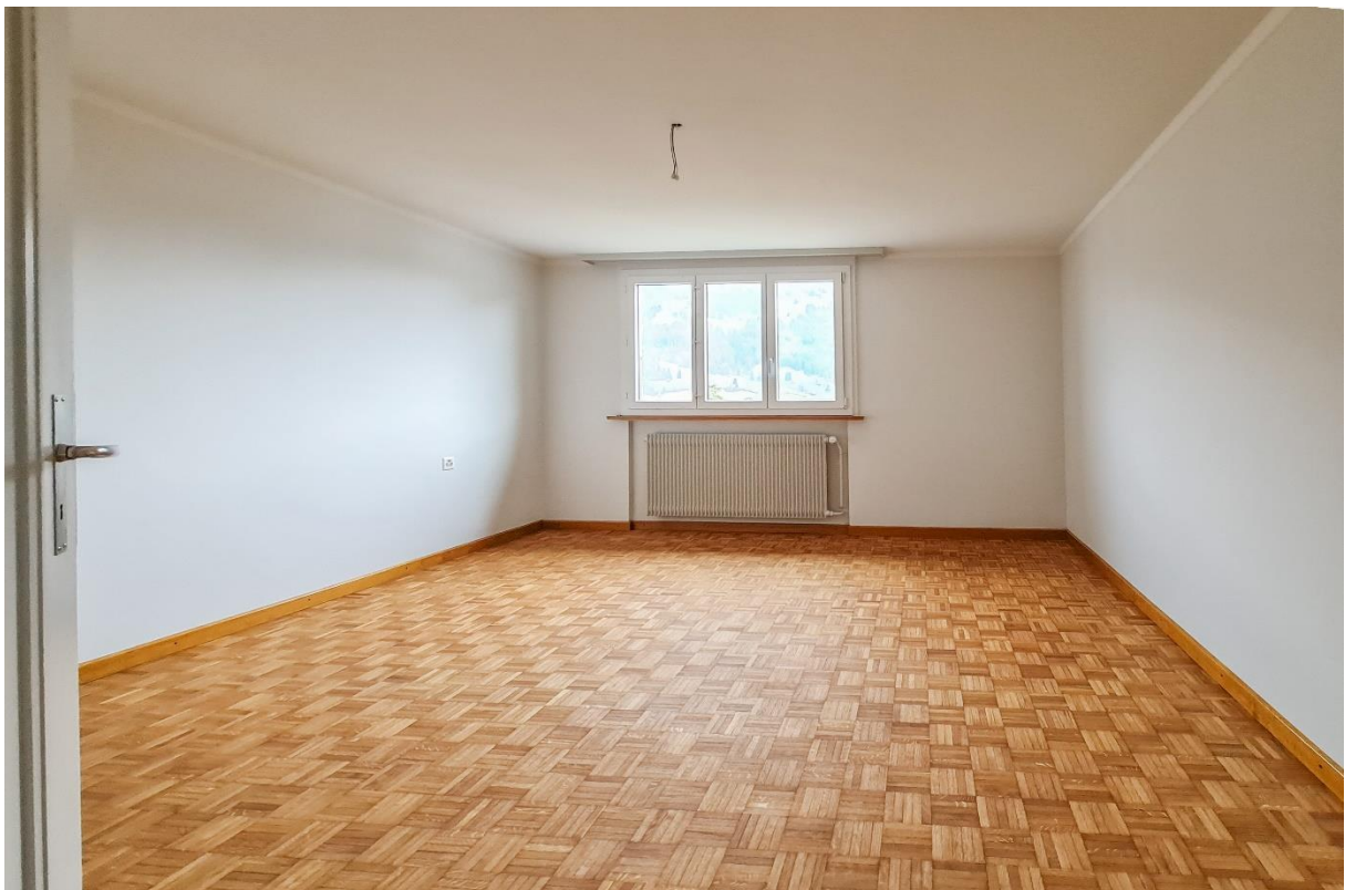
Zimmer Nr. 1