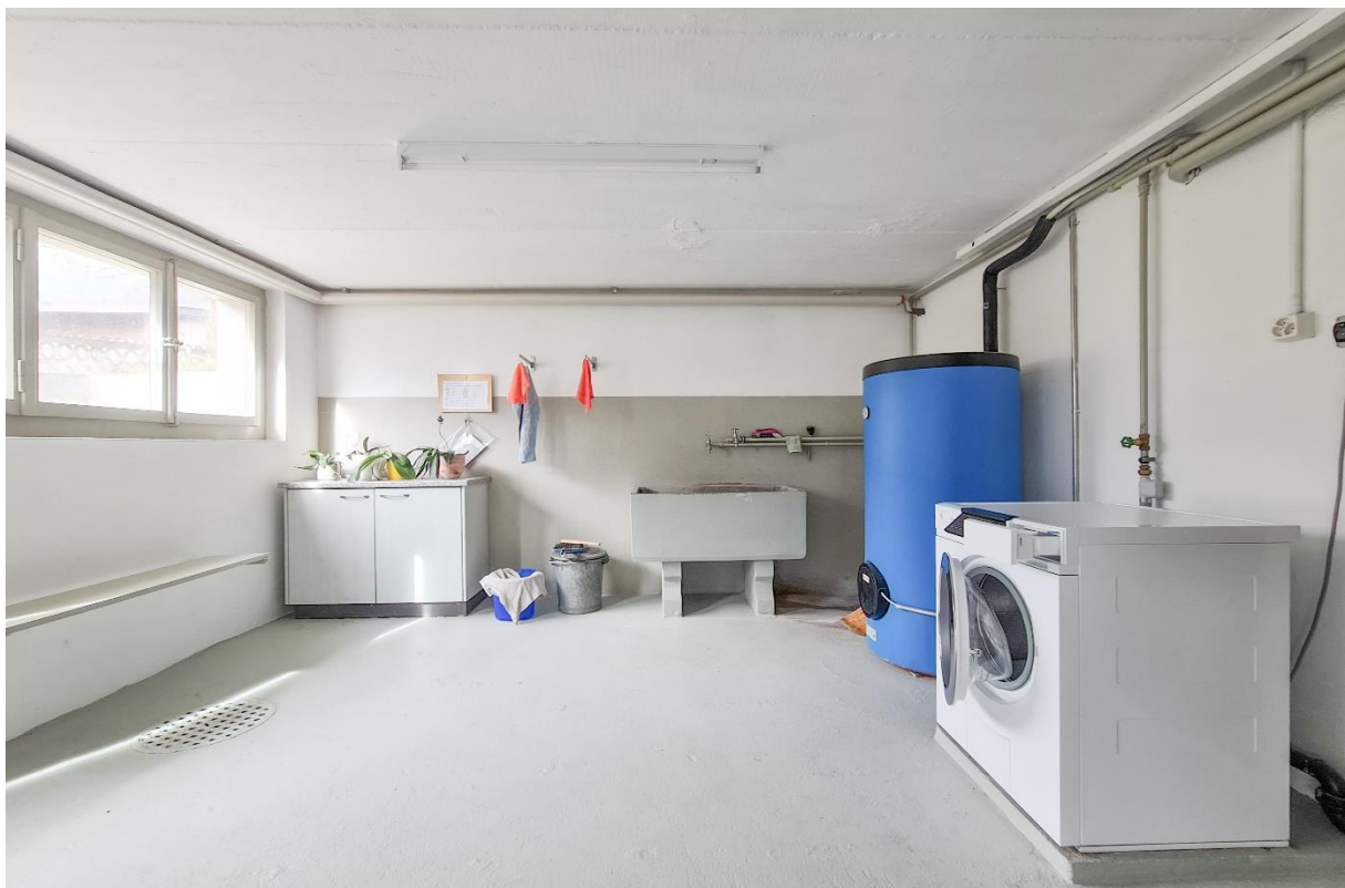
Die gemeinschaftliche Waschküche...