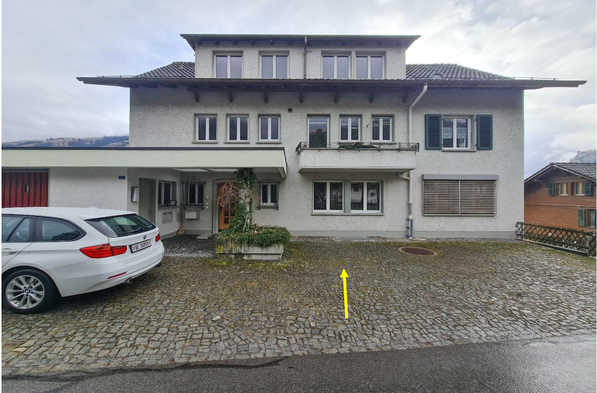
Die Ansichten des Wohnhauses mit dem Aussenparkplatz