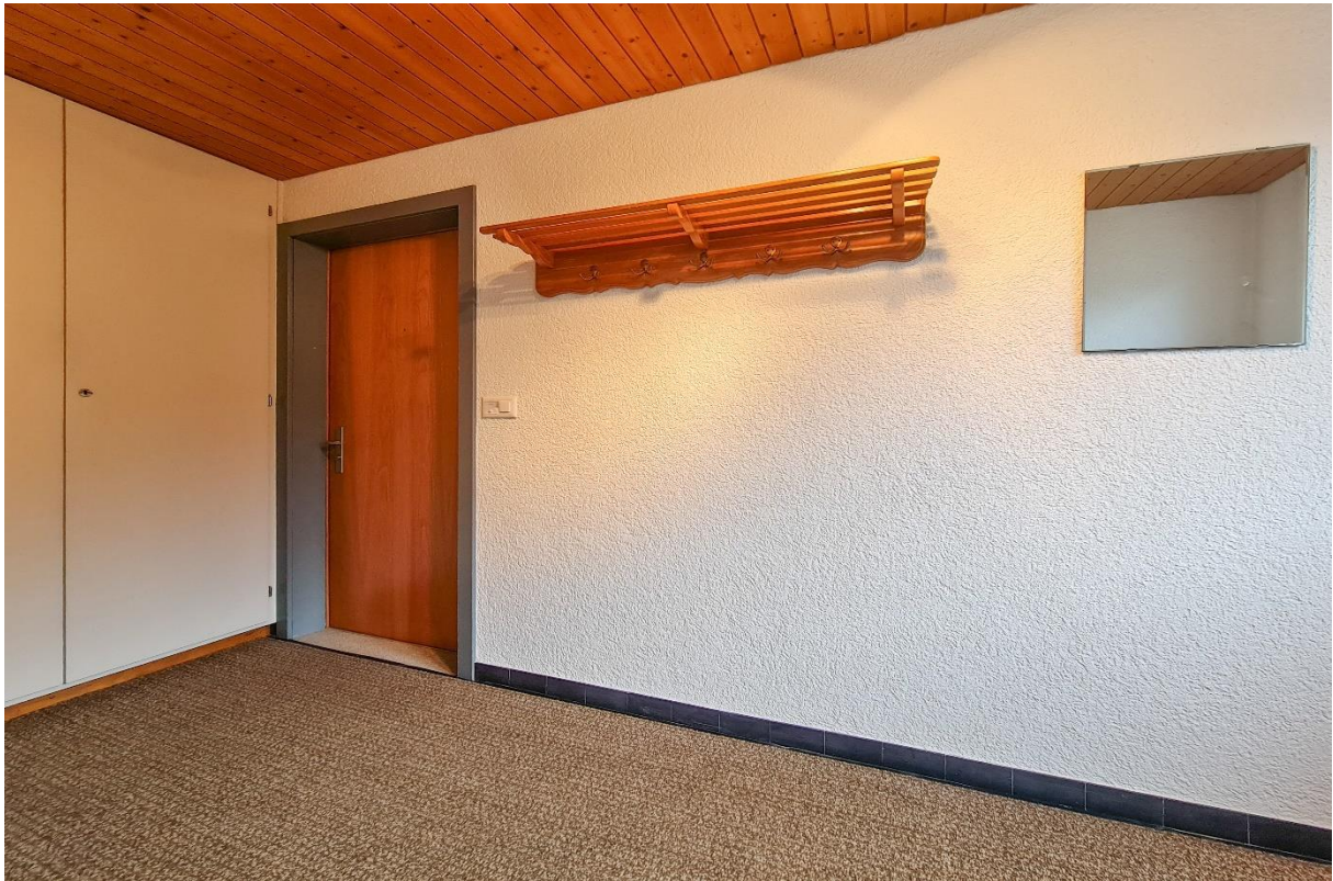
Der Zugang in die Wohnung im Dachgeschoss mit Einbauschränken und Garderoben- Vorrichtung

Nach dem Betreten der Wohnung gelangt man in den grosszügigen Korridor mit Zugang zu den Räumlichkeiten