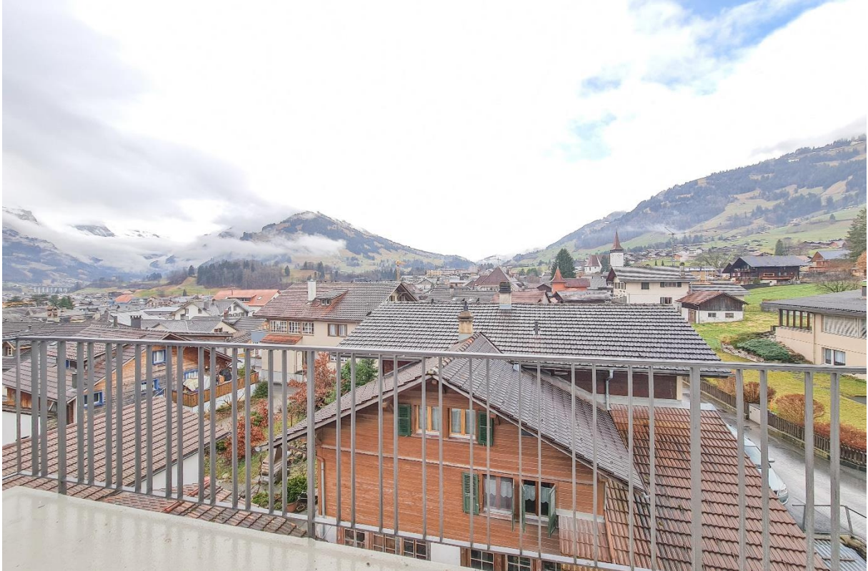
Der Balkon mit freier Aussicht über Frutigen