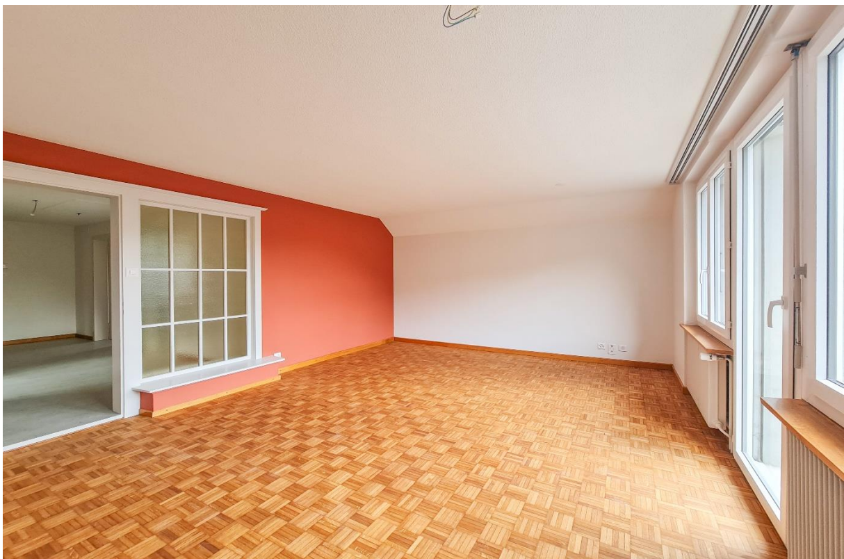
Das grosszügige Wohnzimmer mit Ausgang auf den Balkon