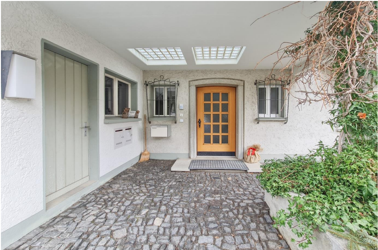
Der gemeinschaftliche Hauseingang