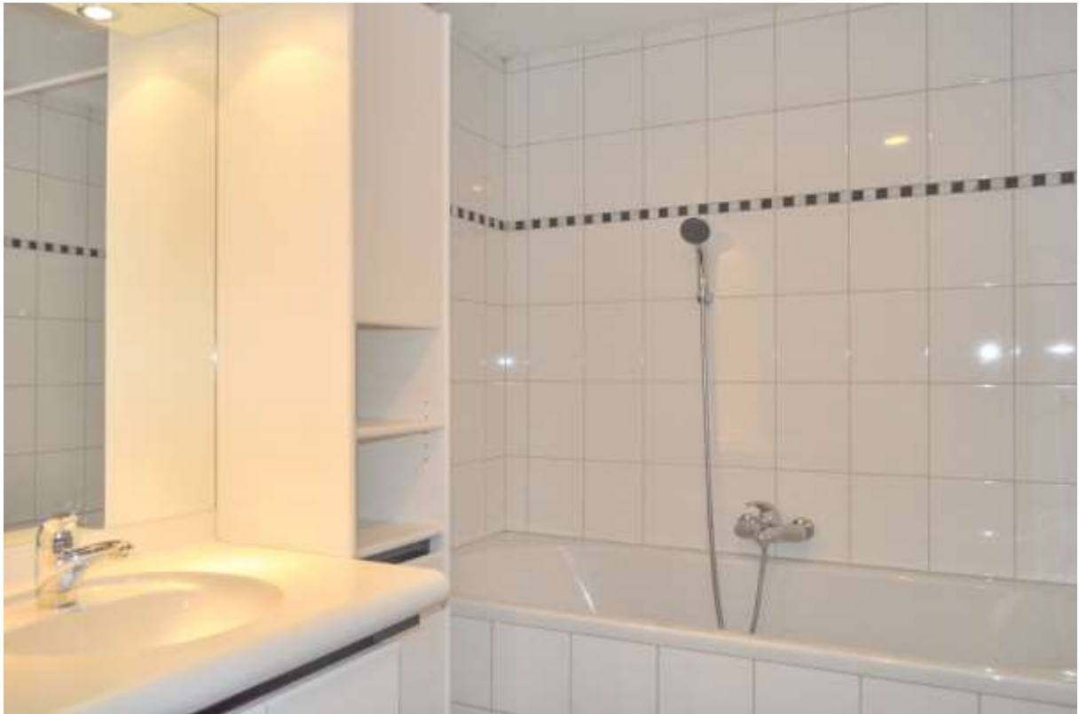
Das Badezimmer mit breiter Wanne, Handwaschbecken, Toilette und Handtuchrockner