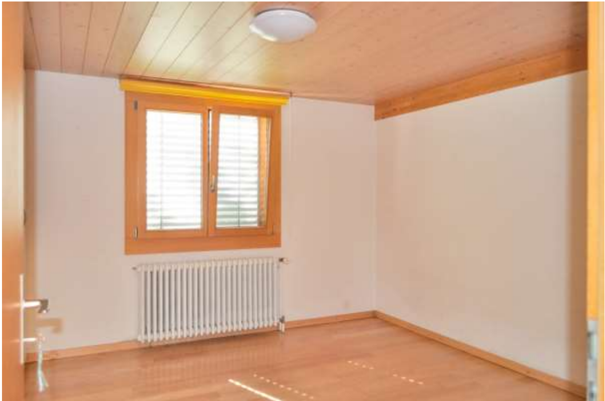
Zimmer Nr. 1