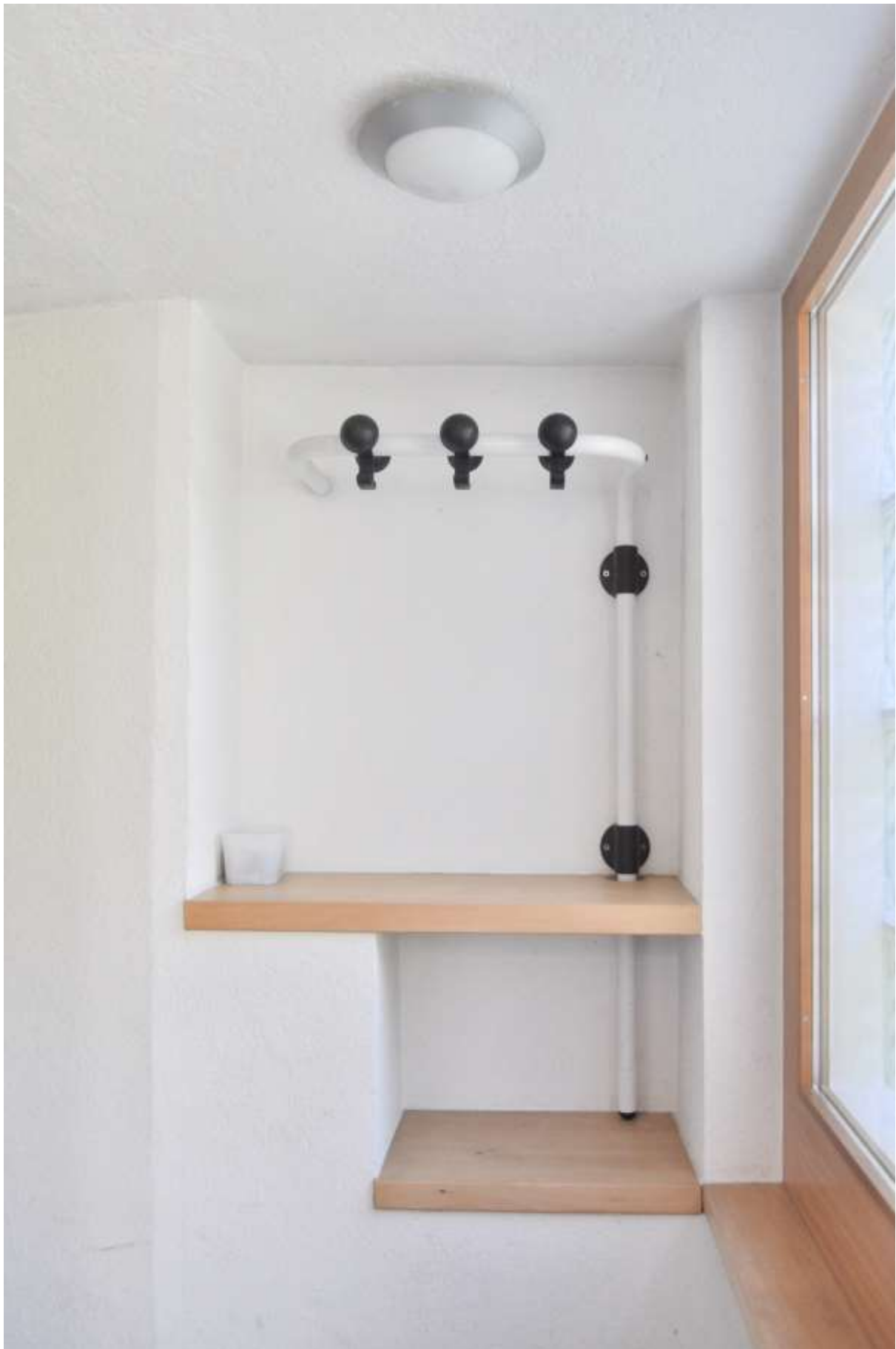
Der Eingangsbereich mit Garderobe