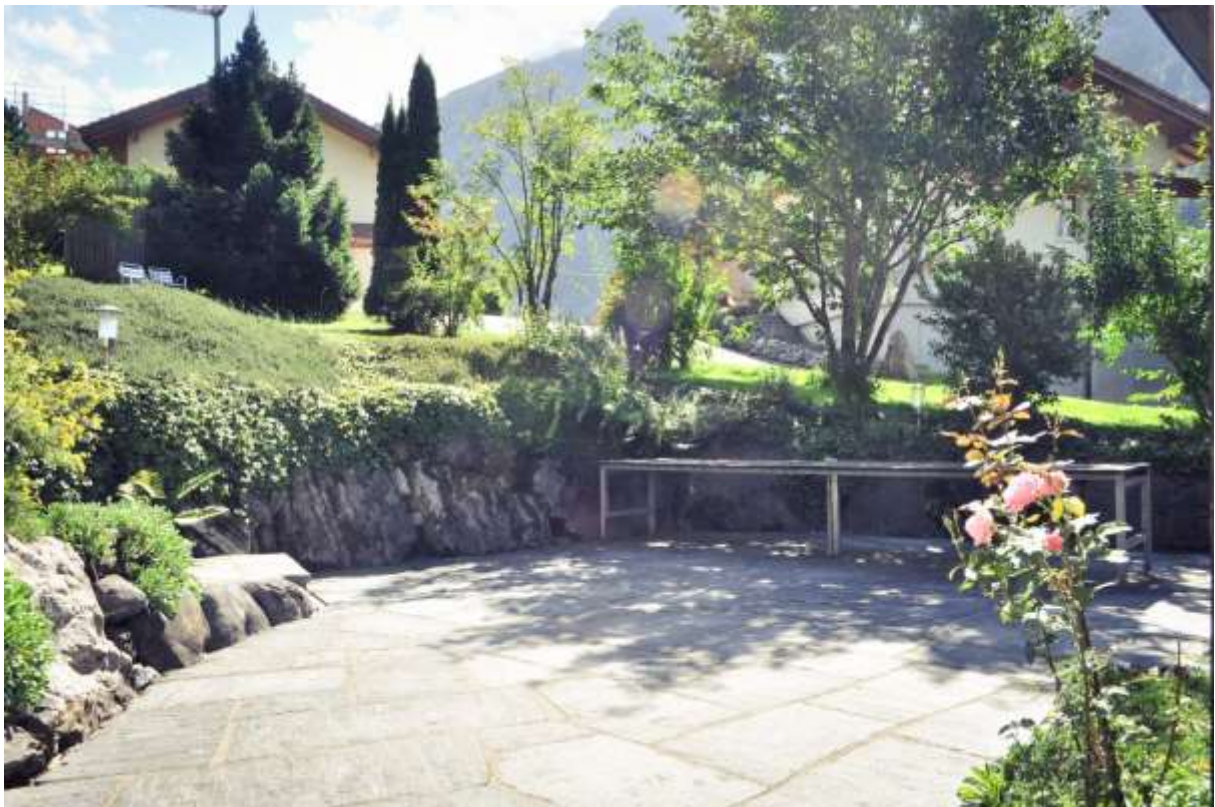
Die eigene Terrasse mit Zugang vom Wohnbereich