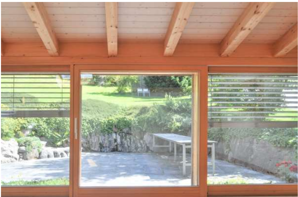
Der Ausblick und Ausgang auf die eigene Terrasse