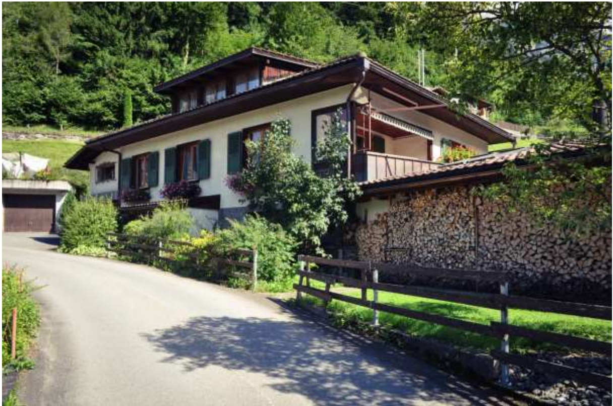
Die Zufahrt und die Garagenbox