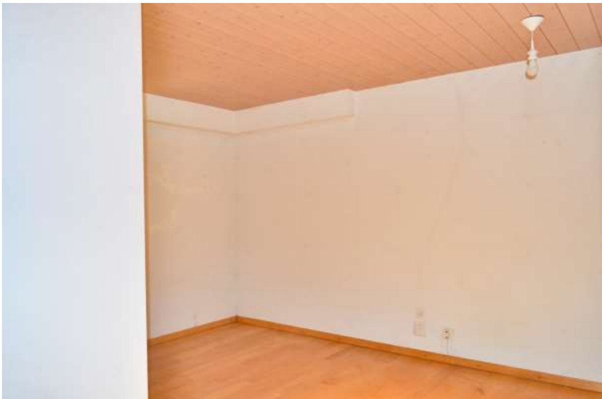
Zimmer Nr. 2