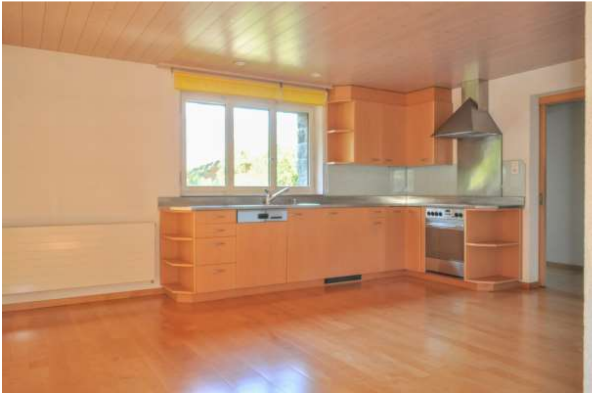
Die helle offene Küche mit Wohnbereich