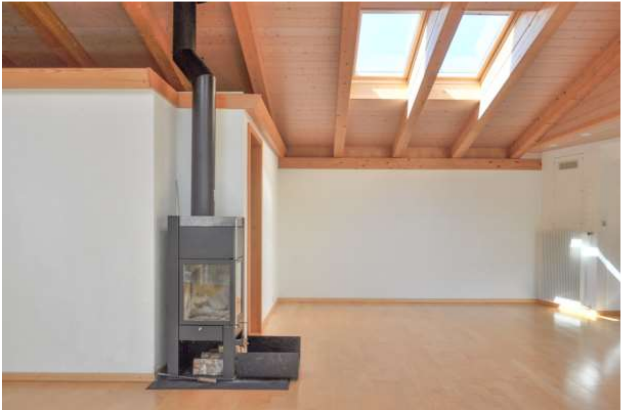
Der Schwedenofen für die Übergangsmonate