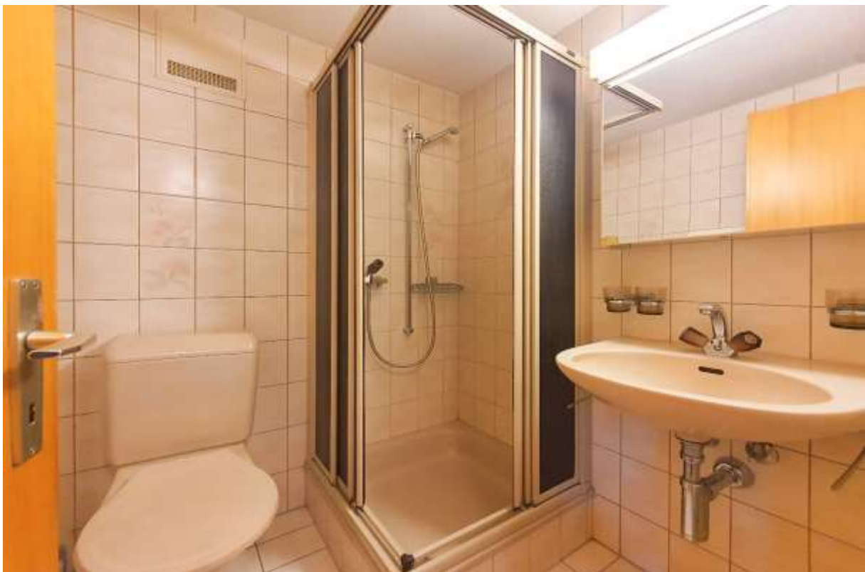
Das Badezimmer mit Dusche, Toilette und Handwaschbecken