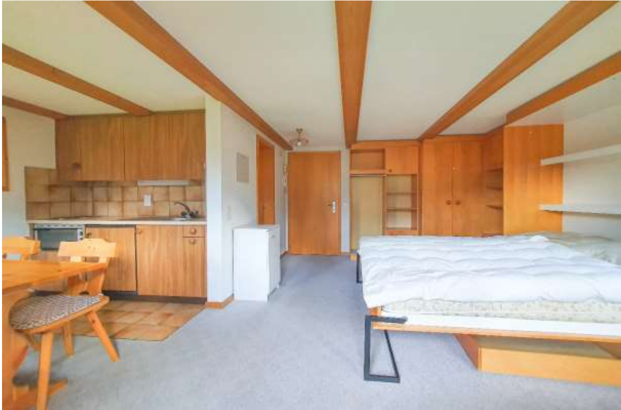
Die einfache Küche mit Eckbank