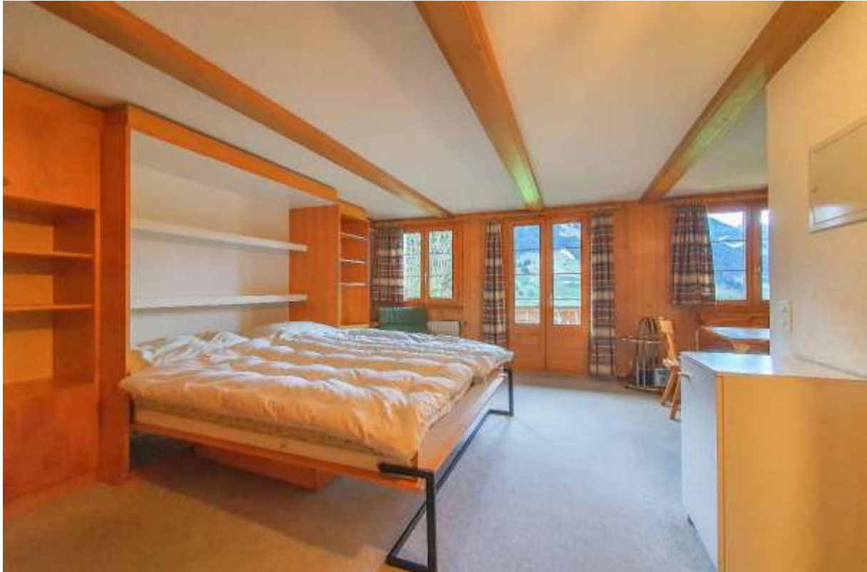
Das ausklappbare Bett mit Einbauschränken