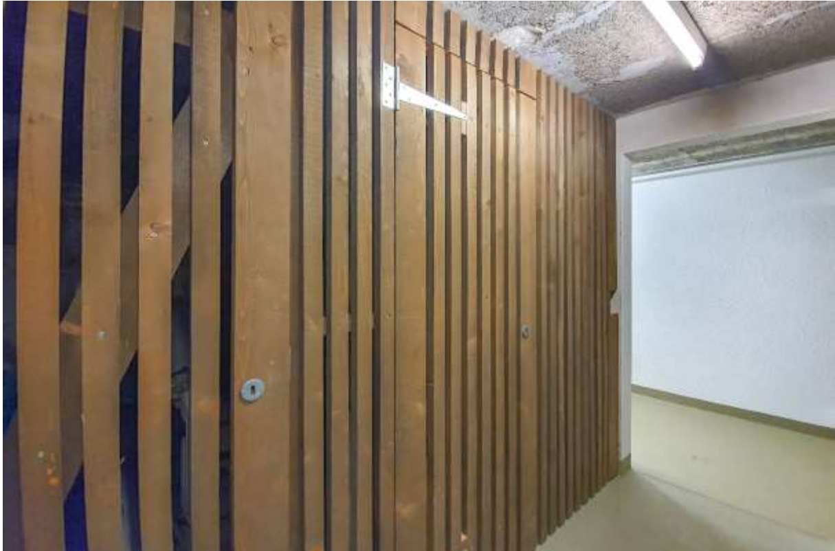
Das eigene Kellerabteil