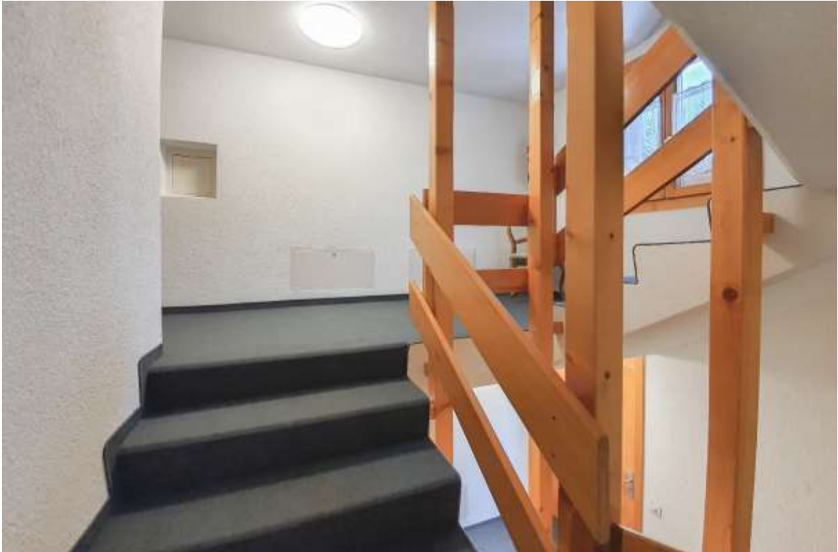
Der Zugang zum Studio über den Treppenaufgang (kein Lift) ins 2. OG