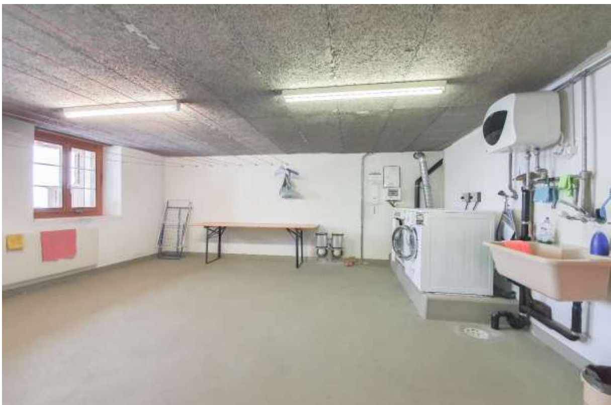
Die gemeinschaftliche Waschküche