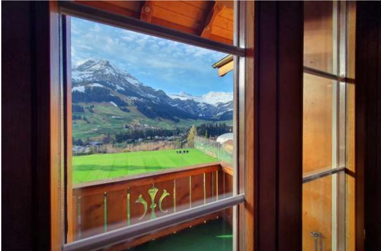
Der Ausblick vom Balkon